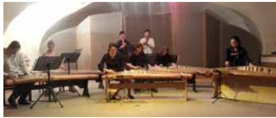
koto student performance

The keystone performance of the whole festival was the student concert which closed the festival on the final night. What a climactic performance it was. I was blown away by the skill of the koto class. I don't think any of the students own a koto, yet they all succeeded in playing with grace, coordination and musicality - a testament to the level of teaching at PSF, as well as to the dedication and enjoyment of all who attended. Each student group played with fearless dignity and poise, even during the organized chaos which is San'an played by multiple flutes. And the audience was warm, receptive and encouraging throughout. Clearly, the supportive family-like atmosphere is something everyone who attended the PSF should be proud of.