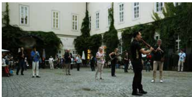
performance in the courtyard

The next day we met in the courtyard of HAMU, the premier Czech Republic music school; an incredible place steeped in history and endowed with great beauty. The opening concert found us nestled in the central courtyard, the water-wells of which are said to be ancient and the cobblestones showing centuries of use. There could be no better venue for the ceremony of sound which proceeded. As I waited for my beer to be poured at the quaint